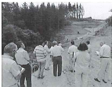
小規模治山工事（八束地区）

今金浄化センターの長寿命化については、計画どおり進められているため、引き続き予算確保に努め長寿命化を推進していただきたい。