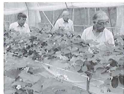
イチゴ栽培ハウスの状況