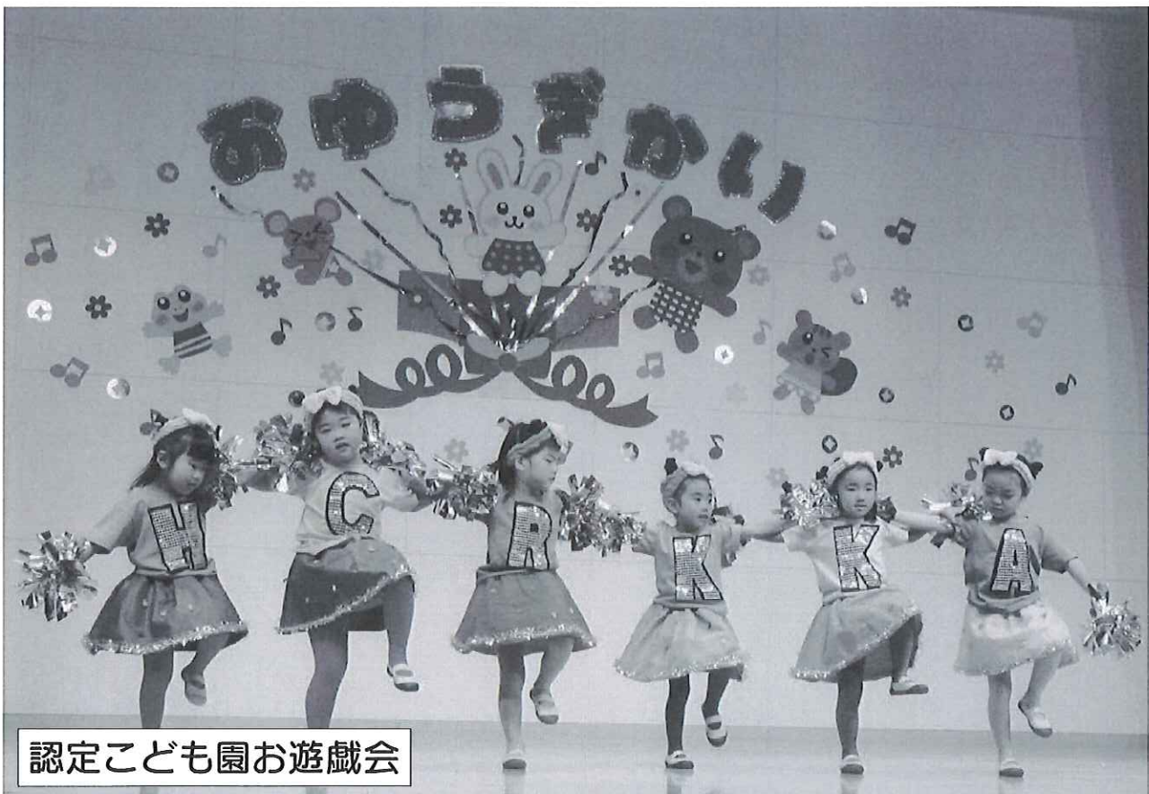
認定こども園お遊戯会