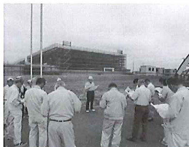
新総合体育館建設工事の進捗状況