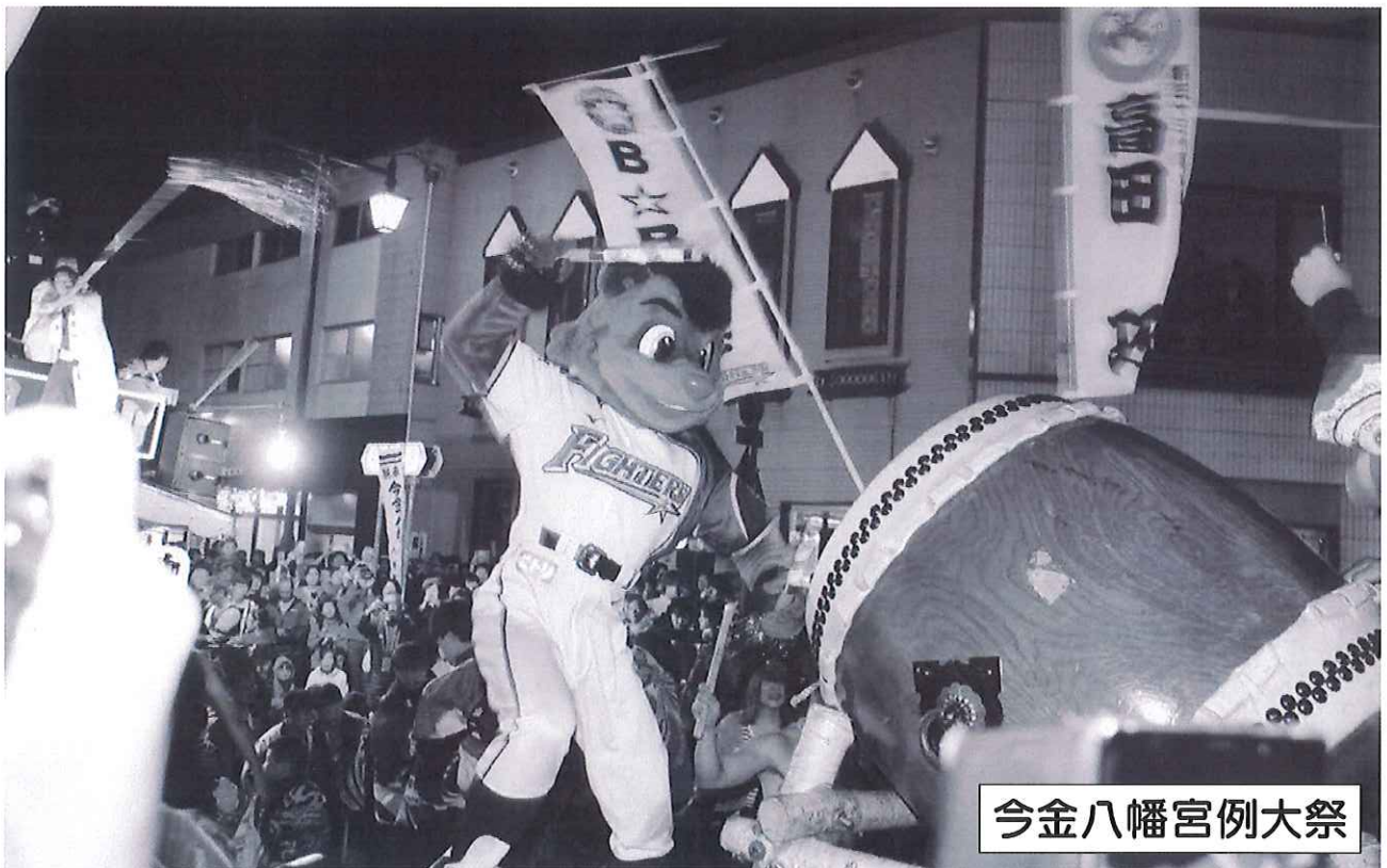
今金八幡宮例大祭