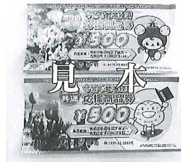
今金町地域経済応援商品券（見本）