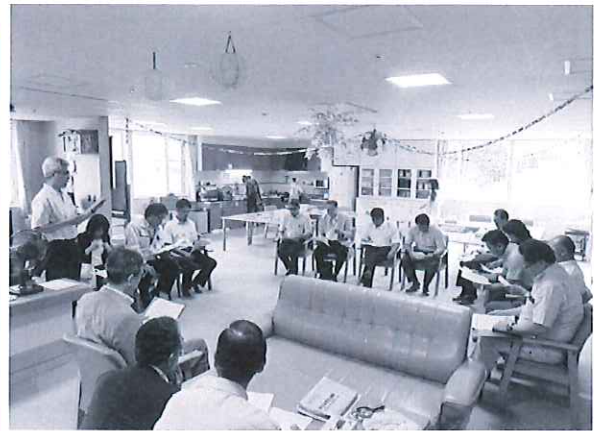
高齢者共同生活施設「せせらぎ」 において事業の説明を受けている様子

高齢者共同生活施設「せせらぎ」、障がい者支援施設「ひかりの里」、特別養護老人ホーム「豊寿園」の運営状況、南団地町営住宅屋根塗装工事、南栄町地区町有住宅改修工事の進捗状況、各生活改善センター等災害用備品の整備状況、美利河地区町有地の活用状況、ちょっと暮らし体験住宅の状況確認について現地調査を行いました。