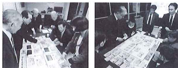
公共施設マネジメントゲームの様子