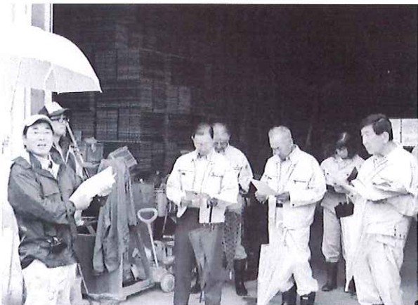
水稻試験圃場（八束地区）において生育状況 について説明を受けている様子