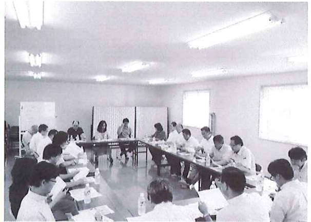
障がい者相談支援事業所「ひかり」 において事業の説明を受けている様子

市街地における遊休町有地（御影町住宅跡地・旧オナヤ旅館跡・大和団地分譲地、交番裏、あつたか団地、中学校前）、文書管理センター、認知症対応型グループホーム「すえひろ」、障がい者相談支援事業所「ひかり」、障がい者グループホーム「ひかりホーム」、南団地町営住宅屋根塗装工事現場、やすらぎ苑前の樹木・花壇撤去跡、植物工場建設予定地、種川宮前団地町営住宅解体工事現場、特別養護老人ホーム「豊寿園」、町民センター、あつたからんどについて現地調査を行いました。