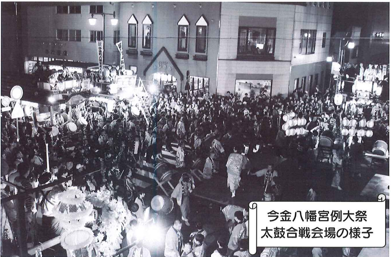
今金八幡宮例大祭 太鼓合戦会場の様子