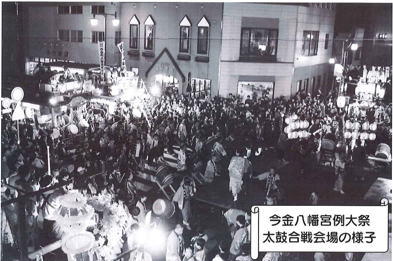
今金八幡宮例大祭 太鼓合戦会場の様子