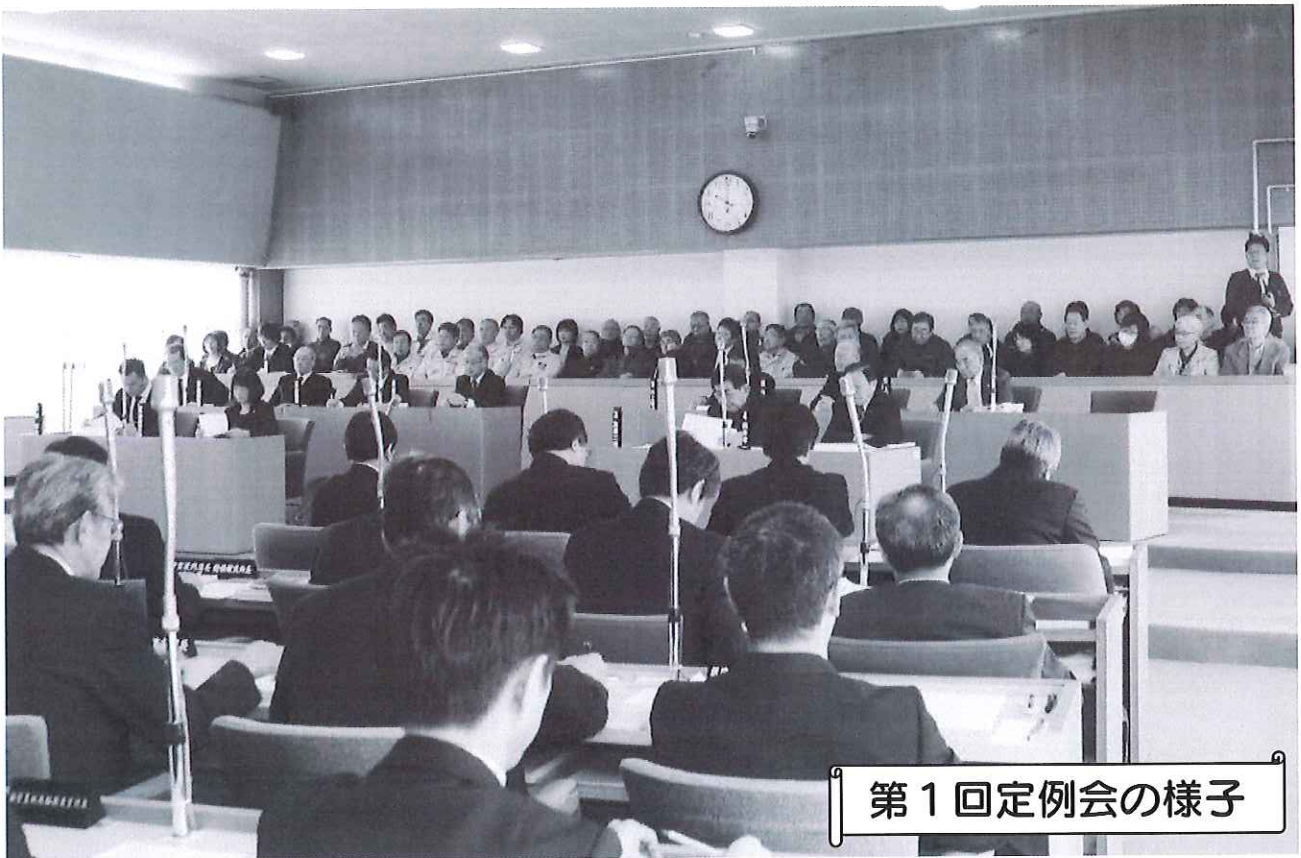
第1回定例会の様子