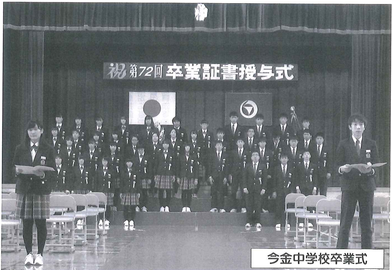
今金中学校卒業式