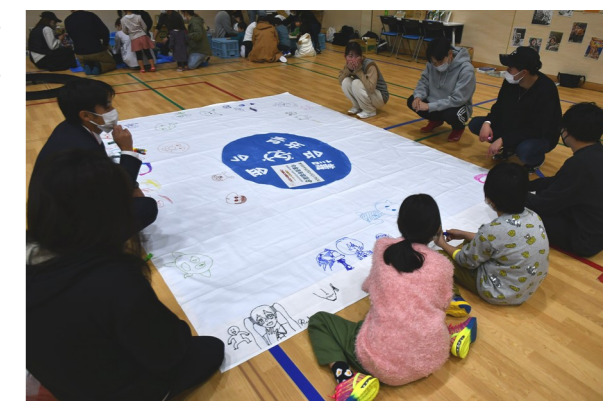
▲青年会議の活動(わくわくフェスティバル)

春を迎え、新しい年度が始まります。新しい土地、場所において、新しい仲間と気持ちも新たに活動がスタートします。たくさんの方の交流、出会いが生まれ、それぞれが笑顔で楽しくいろいろなことに挑戦できる年になると良いかなと思います。