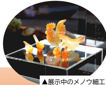
▲展示中のメノウ細工

このたび、展示内容を掘り下げた講演会を、下記の日程で開催します。どなたでも参加できますので、ぜひこの機会にお越しください。