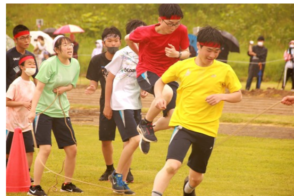
▲目指すは記録更新！3年生の長縄跳び

コロナ禍を経て久しぶりの今中体育祭の観覧。生徒のみなさんを最後に見たのは小学生のころだったでしょうか？そして今、中学校3年間の子どもの成長はやっぱりすごいなと感じました。