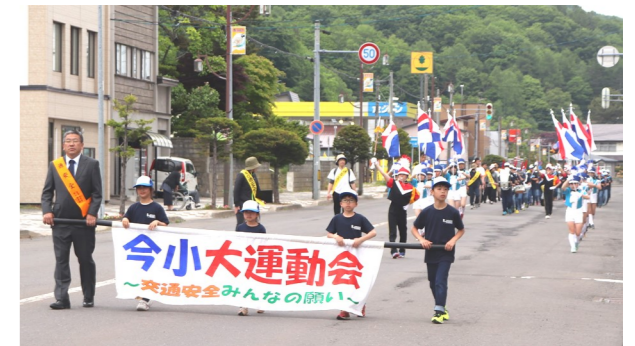
▲豊かな音色が町に響いた鼓隊パレード