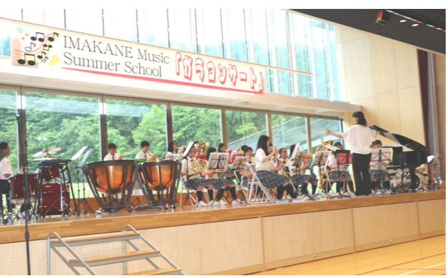
▲2019年ガラコンサート(会場:今金小学校)

今金ミュージックサマースクール(通称MSS)は、札幌交響楽団の奏者をはじめ有識者を招聘し、今金中学校吹奏楽部や近隣の中学校吹奏楽部の部員たちが技術指導を受け、音楽に対する関心や技術の向上、相互交流を目的に平成26年度より行っています。今年度は7月1日から2日間指導を受け、その成果発表としてコンサートを下記の日程で開催いたします。コンサートでは各中学校だけでなく、札幌交響楽団の講師のみなさまの発表もあります。4年ぶりの開催です。たくさんの方のご来場をお待ちしています。