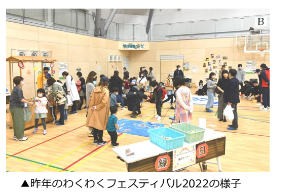
▲昨年のわくわくフェスティバル2022の様子