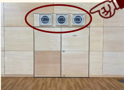
アリーナ器具庫ドア