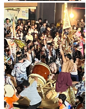
4年ぶりの本格的な今金八幡宮祭典