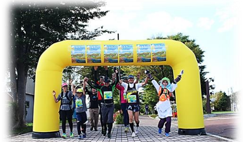
▲今金男しゃくマラニックの様子

自分自身や身近な大切な人の健康のためにも、今は我慢の時！ そう遠くない未来にたくさんの笑顔であふれるといいですね。