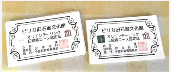
▲全問正解者の方には「認定証」を贈呈します

このたび、ピリカ旧石器文化館の展示内容をテーマとするオリエンテーリングを始めました。展示室入口に用具一式があり、誰でも取り組むことができます。展示テーマの順に10問の設問に答えるもので、初級者コースと上級者コースの2コースがあります。いずれも展示物に答えが隠されています。それぞれ全問クリアすると、名刺サイズの公式認定証がもらえます。ぜひ挑戦してみてください！