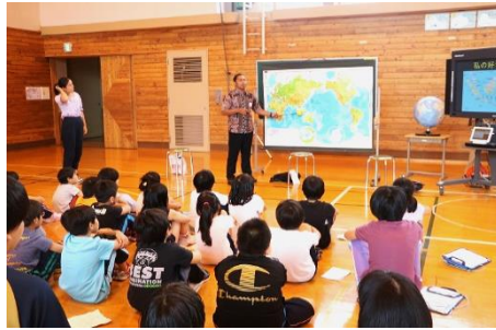
▲種川小学校との交流