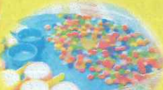
こども縁日コーナー♪