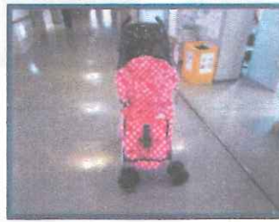
ベビーカーのカバー