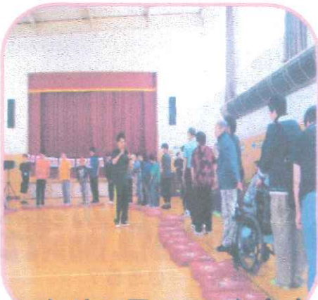
ひかりの里ミニレク大会

6月24日(土) ひかりの里ミニレク大会、6月25日(日) 大和町ふれあい交流会、7月1日(土) 民協七夕ふれあい広場に社協職員もお手伝いに行って来ました。どの事業も参加者の笑顔が見られて、たくさん元気をいただいて来ました。