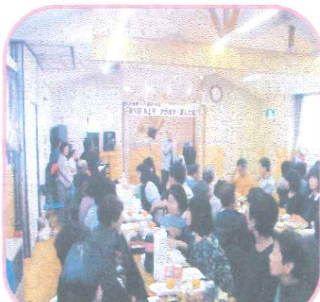
大和町ふれあい交流会