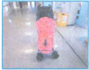
ベビーカーカバー