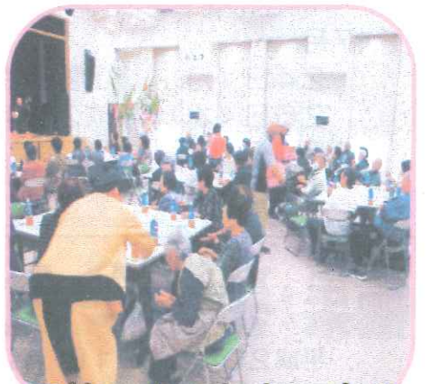
民協七夕ふれあい広場