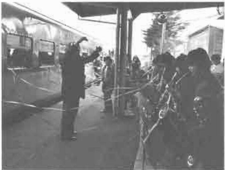
今金中学校音楽部の「螢の光」に送られて

で気動車に変わり、少しは貨物輸送となった。その貨物も、結年には美利河駅を始点とする7駅が集約化、無人駅になるなど昭和49年2月1日で荷物取り扱いが完全廃止となり、力強く走り続けたSLの雄姿を姿を見ることができなくなつた。