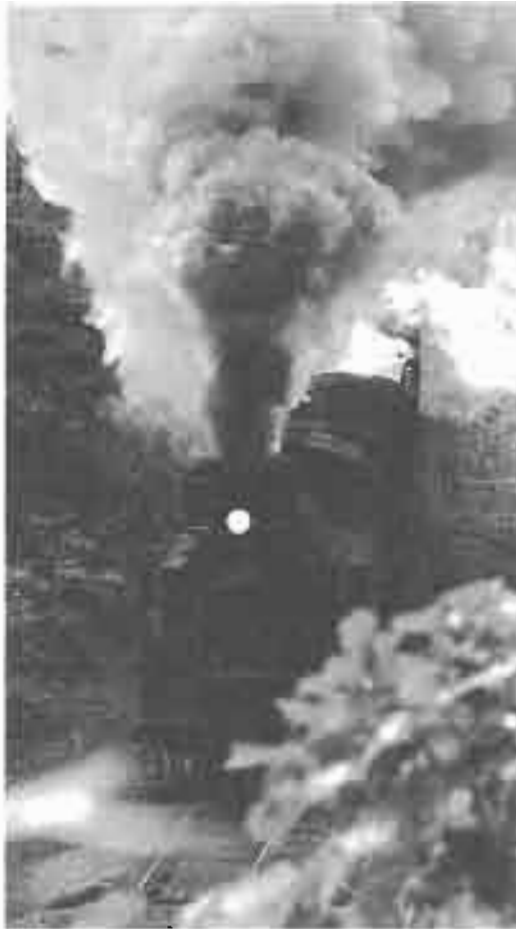
昭和59年2月1日で完全廃止となったSL(美利河トンネル前)