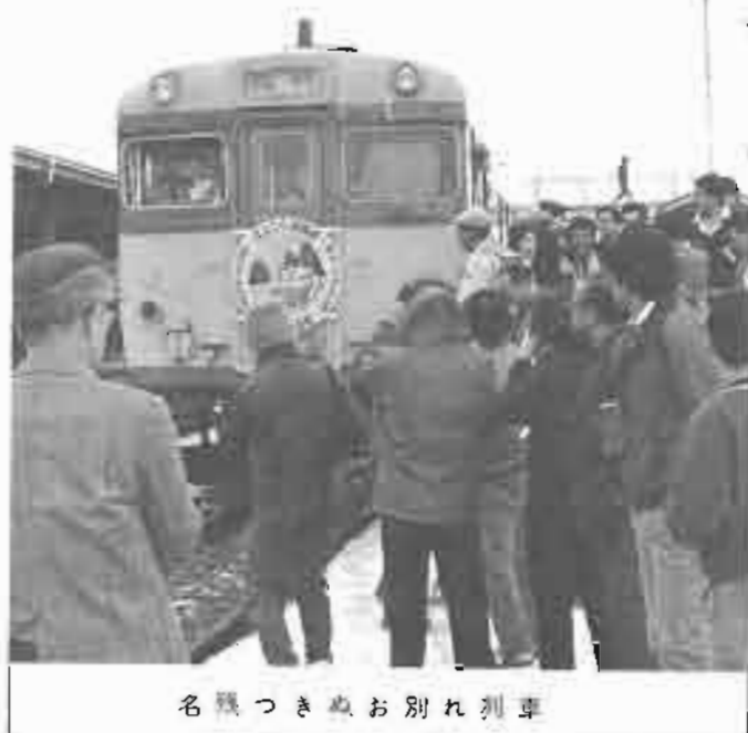
名残つきぬお別れ列車

ホンカイドが販売されるなど、さまざまでした。それぞれの胸にそれぞれの思いが刻みこまれたことでしょう。