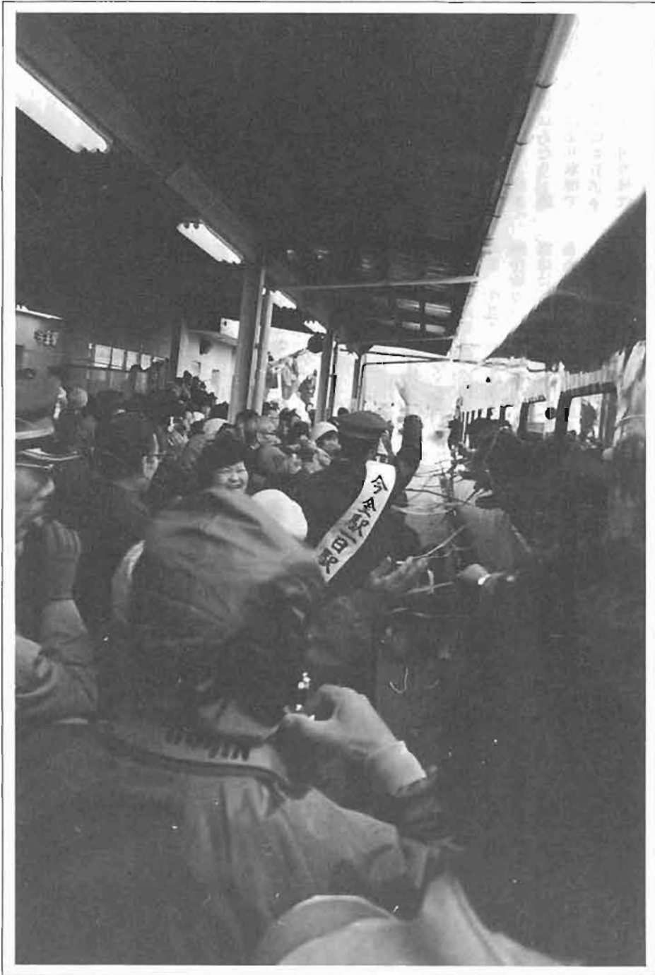
3月15日別れをつげた瀬棚線