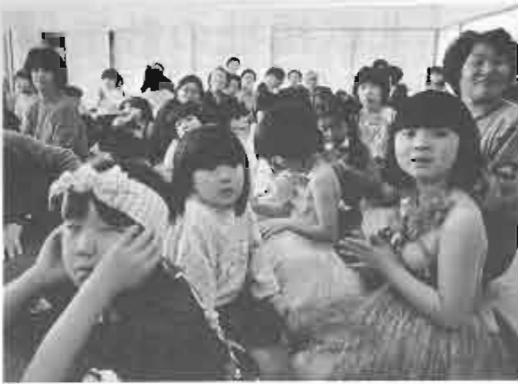
和気あいあい 演芸も楽しく

の園児等60人が参加して行われました。 お爺ちゃんお婆ちゃんと園児たちの歌や踊りが交歓、お互いにおしめない拍手を贈りあっていました。お昼には、仲よく給