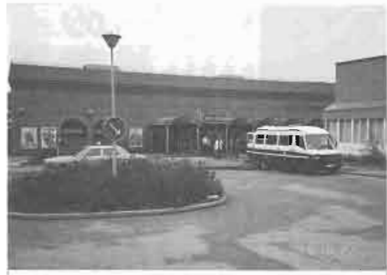
ショッピングセンターに隣接する心障者施設

発の航空機で目指すスウェーデンへ向う。小型な航空機だったので、ゆれが激しく不安感に支配されたが、このあたりは、強風と気圧の変化から揺れるのが当たり前だ。機内には、北へ進むにつれて、だんだんと日本人客の数が減少し、やつと外へきたのだとの実感が湧き上ってくる。