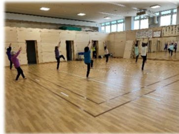
▲フィットネスの動き

有酸素運動であるウォーキング、ジョギング、アクアビクス、スイミング等とともに、心肺機能が高まり、体が活性化して、エネルギーを燃焼しやすい体になるばかりか、中性脂肪や血圧、血糖値は抑えられ、ついでにストレス解消に努めましょう。