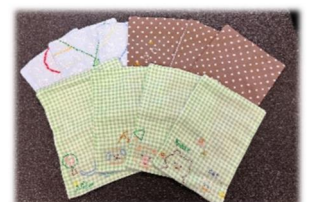
▲消毒液台受けの布(刺しゅう入り)の寄贈