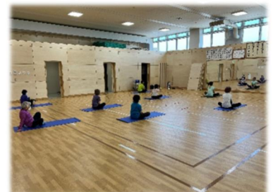
▲最後にストレッチで体を整える