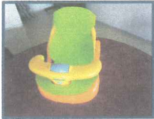
ベビーバスチェア