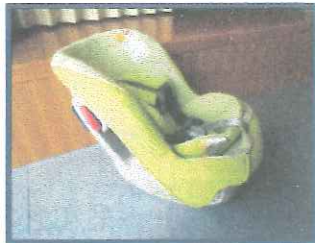
チャイルドシート