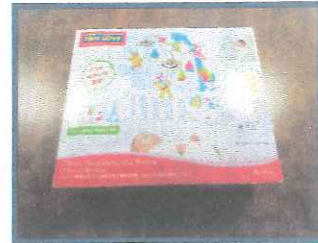
メリーゴーランド