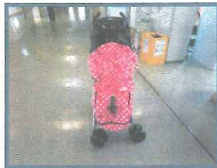
ベビーカーのカバー