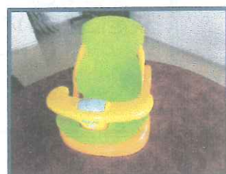
ベビーバスチェア