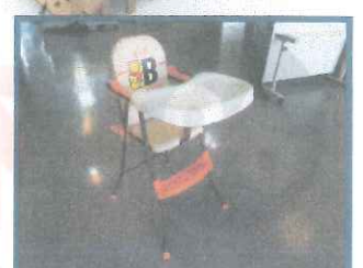
トレイ付きベビチェア