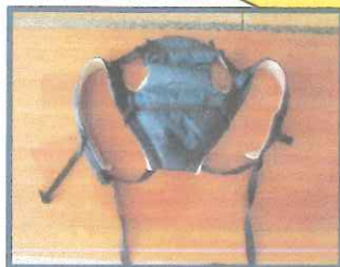
抱っこ紐 2つあります