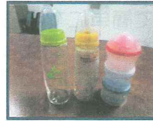
哺乳瓶 (新品) ミルク小分けケース