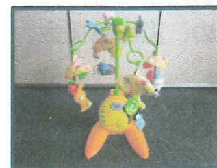
オルゴールメリー