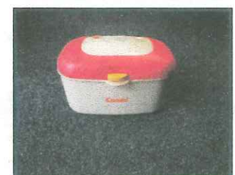
おしりふきウォーマー