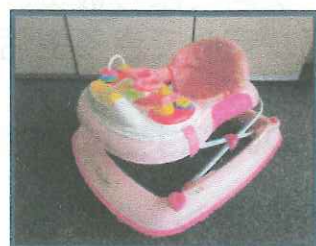
ベビーウォーカー