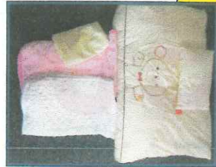
ベビー布団セット