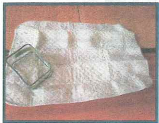
オムツ替えシート