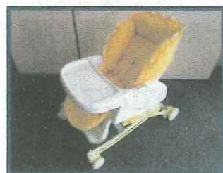
ハイローベッド&チェア