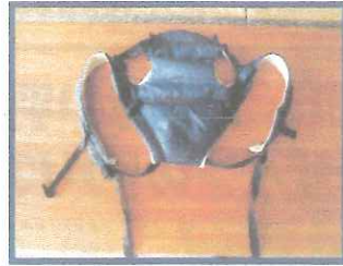
抱っこ紐 2つあります