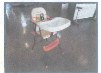
トレイ付きベビーチェア