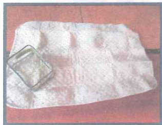
オムツ替えシート