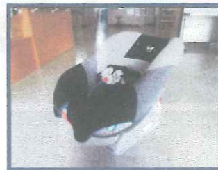
チャイルドシート