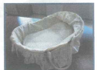
クーファン 2つあります