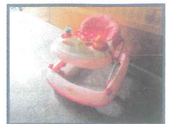
ベビーウォーカー