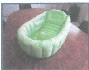
ふかふかベビーバス