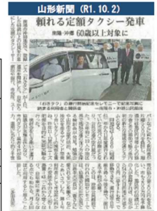
図5-9 山形市市郷地区で実施しているタクシー運賃低廉化措置の事例