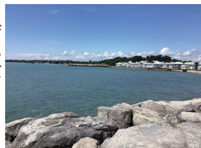
▲実家に近いエリー湖の風景

アメリカと国境を接する五大湖は有名ですね。私の両親は五大湖の中で最も小さなエリー湖の畔に住んでいます。有名なナイアガラの滝はエリー湖とオンタリオ湖の間にあります。滝や湖のことについて聞きたいことがあれば、何でも私に聞いてください！