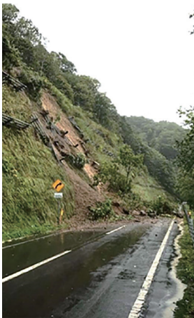
▲道道丹羽今金線土砂崩れ