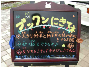
〔写真は春らんまん花いっぱいフェスティバルのものです〕