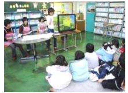
学校での読み聞かせ