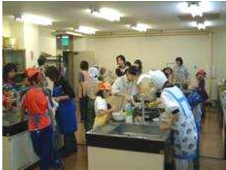
図書まつりのお手伝い