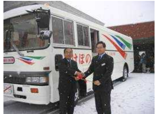
道立図書館館長より図書館職員の想いと一緒バスを譲り受ける中島教育長

種川小学校 午前 9:25 ~ 午前 9:45 神丘小学校 午前 10:15 ~ 午前 10:35 美利河小学校 午前 11:45 ~ 午前 12:00