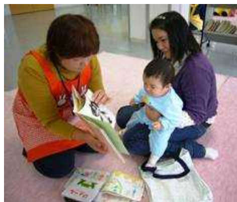
ブックスタート事業の様子

ブックスタートはこの世に誕生し、やがて社会の一員として巣立っていく子どもたちの大切な出発点に始まる子育て支援でもあります。