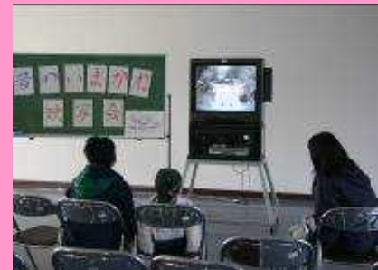
とても貴重な、「いまかねの昔」 を上映しています。