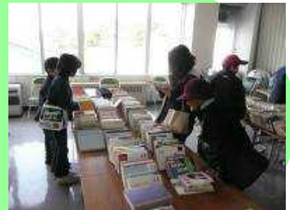
毎年好評のブックリサイクル