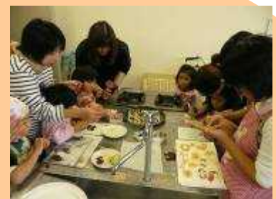
楽しく作った絵本のクッキー