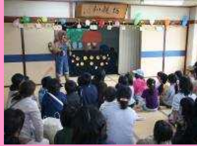
マザーズぽけっとの人形劇。 みんな真剣に見入っています。