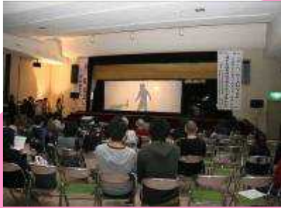
「泣いたあかおに」の一コマ。 工夫を凝らした演出でした。

去る10月27・28日に開催された第4回いまかね図書まつりの様子をお知らせします。この図書まつりは、あらゆる年齢層が本に触れる機会を提供し、豊かなライフステージへのきっかけづくりとします。また、各関係機関、団体、個人との出会いや交流を通し、それぞれの活動を発展されるとともに町民の生涯学習への意欲を高め、安心して暮らせる豊かで文化的な街づくりを目指します。