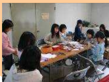
大人気だったしおり作りコーナー