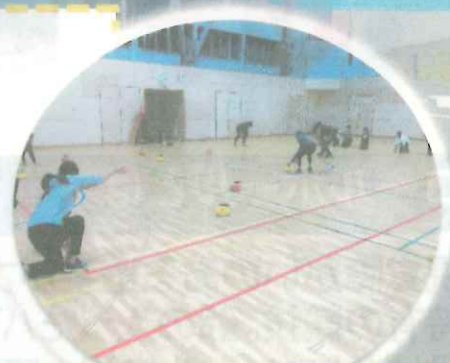
フロアーカーリングの様子

パラリンピックの普及・知名度アップを目的とし、 9月まではパラリンピック種目をメインとしています！