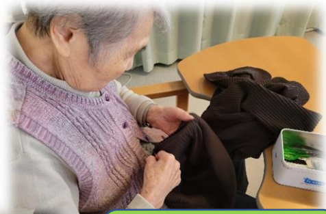
繕い物をする taking up the hem