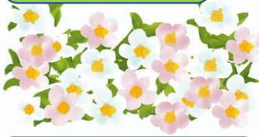
春を感じる signs of spring