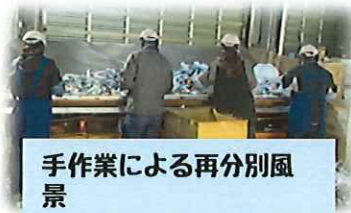
手作業による再分別風景