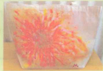
太陽のバックをつくろう！