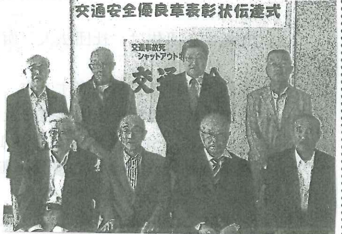
交通安全優良章表彰状伝達式

～オンライン講習（モデル事業）について～ 講習区分が『優良』『一般』でマイナンバーカード（有効な署名用電子証明書）をお持ちの方は、お家で更新時講習が受けられます。オンライン講習を受ける方は、 受講後 、警察署の窓口で更新手続きを行って下さい。詳しくは、北海道警察ホームページをご確認ください。