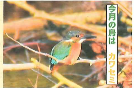
今月の鳥は カワセミ

カワセミ科 カワセミ属 水辺に生息する留鳥で、鮮やかな体長と長いくちばし が特徴