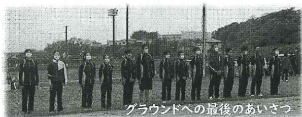
グラウンドへの最後のあいさつ