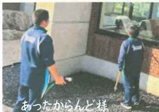
あつたからんど様

また、地域の事業所や施設の皆様には、毎年お忙しい時期に快くご協力頂いていることにこの場を借りて改めて感謝申し上げます。