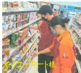
セイコーオート様

文化祭では中心メンバーとして役割や英検などと、忙しい中、家庭での暗記はもちろん、放課後に残ってALTのカトリーナ先生の指導も受けながら準備を進めてきました。暗記だけでなく、感情表現も大切な採点基準になっております。