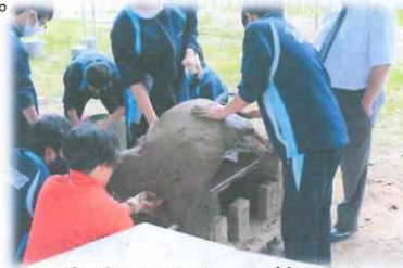
崩壊してしまった第1号

旧校舎の玄関先で使われていたレンガを再利用し、校舎の敷地内の粘土質の土を使って、作製しました。