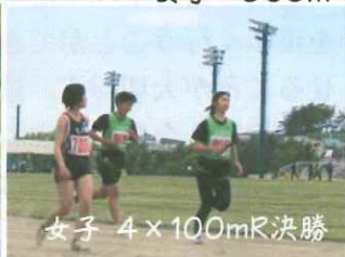
女子 4x100mR 決勝