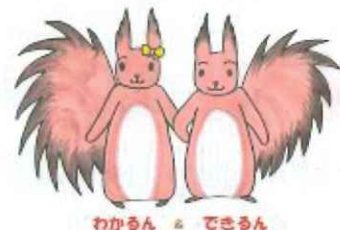
わかるん と できるん