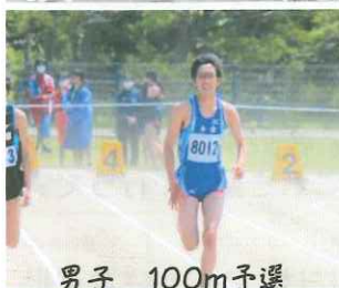
男子 100m 予選