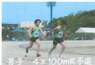
男子 4x100mR 予選