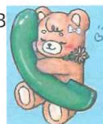
子ども相談支援センターイメージキャラクター