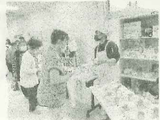
(今金町健康まつり)