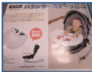
バウンサー用テーブル