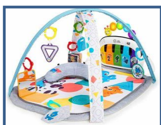
キッキングチェーンズ