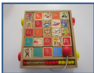
あいうえお積み木