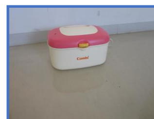
おしりふきウォーマー