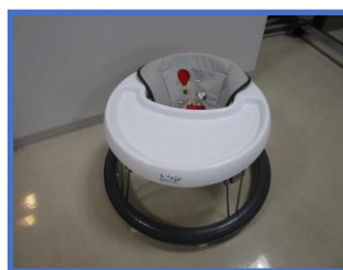
ベビーウォーカー