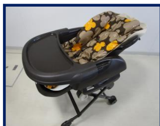
ベビースリングチェア