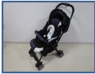
ベビーカー 3台あります