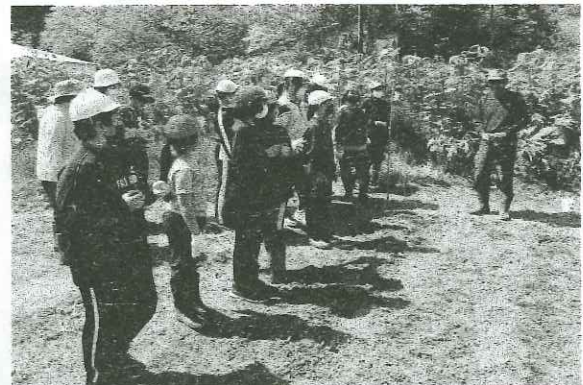
種の植え方を教わりました