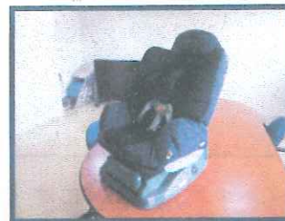
チャイルドシート