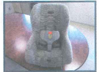
チャイルドシート