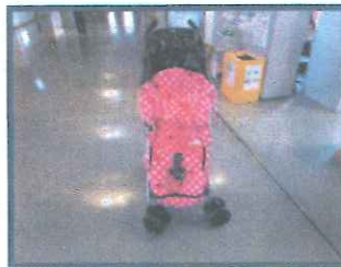
ベビーカーのカバー