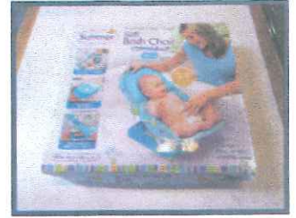
ソフトバスチェア