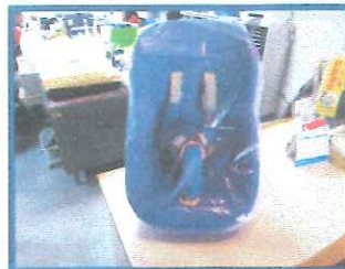
チャイルドシート