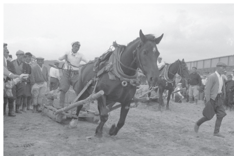
▲町内で行われたばん馬大会の様子 (昭和30年代)

北海道の開拓の時代、馬と人の生活はとても密接に関わっていました。今金町も例外ではなく、昭和30年頃まで使われた馬に関わる当時の道具と一緒に、今金町の馬文化を振り返ります。普段は見られない貴重な資料が出るので、ぜひご覧ください！