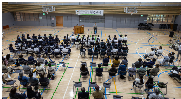
▲昨年度のガラコンサートの様子

北渡島檜山4町（八雲町・長万部町・せたな町・今金町）連携事業として、平成26年からプロの演奏家を講師として招聘し、吹奏楽を学ぶ中学生の技術向上を目指し、IMAKANE Music Summer School（後援：公益財団法人北海道市町村振興協会）を行っています。その事業が今年度をもって10周年を迎えるにあたり、講師の皆さんによる記念コンサートを行います。町民の皆さんには、素晴らしい音楽に触れる貴重な機会となります。ぜひ、ご来場ください。