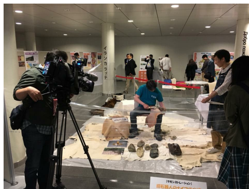
▲平成30年度イベント時の様子（今回は石器づくりの実演はありません）